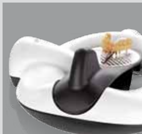
Autour du modèle